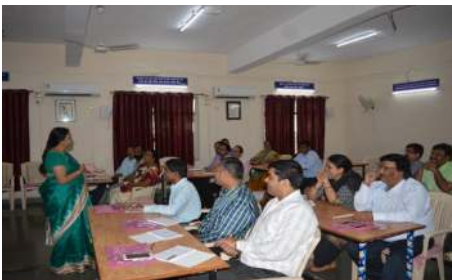
आंचलिक शिक्षा एवं प्रशिक्षण संस्थान मुम्बई में स्नातकोत्तर शिक्षक (वाणिज्य/अर्थशास्त्र/इतिहास) के सेवाकालीन प्रशिक्षण के पाठ्यक्रम निदेशक, सह-पाठ्यक्रम निदेशक एवं संसाधकों हेतु दिनांक 19-04-17 से 21-04-17 तक 03 दिवसीय अभिविन्यास कार्यक्रम आयोजित।