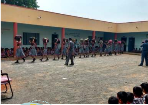
School Safety Program held at KV Haveri. Activities Covered: 1. First Aid for Hand, leg, and eye fracture. 2. First Aid for Spinal Cord treatment. 3. How to save injured people during earthquake. 4. First Aid for Respiration. 5. Accidental Attack & its first Treatment.