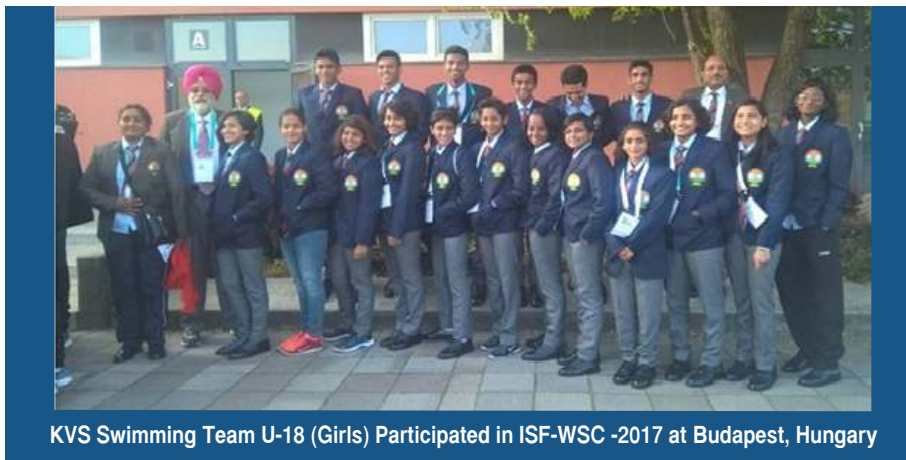
KVS Swimming Team U-18 (Girls) Participated in ISF-WSC -2017 at Budapest, Hungary