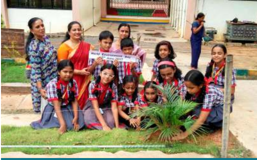
के.वि. डीआरडीओ, बंगलुरु में पौधरोपण कर पर्यावरण दिवस मनाते बच्चे ।