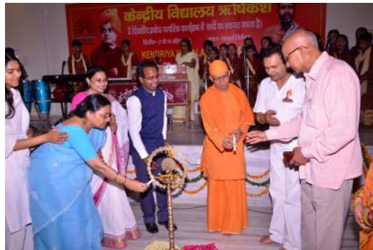
देहरादून संभाग द्वारा 17-18 अप्रैल 2017 को के.वि. ऋषिकेश में जागरूक नागरिक कार्यक्रम आयोजित किया गया। इस अवसर पर सत्र का उद्घाटन करते अतिथिगण।