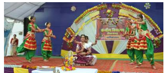
केंद्रीय विद्यालय टीकमगढ़ में आयोजित वार्षिकोत्सव के दौरान नृत्य प्रस्तुत करती छात्राएं।