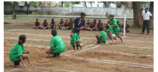
केंद्रीय विद्यालय शहडोल में संभाग स्तरीय खो-खो (अंडर-14, अंडर-19) बालिका वर्ग प्रतियोगिता 2017-18 का आयोजन किया गया।